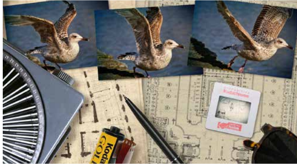
planche de recherches